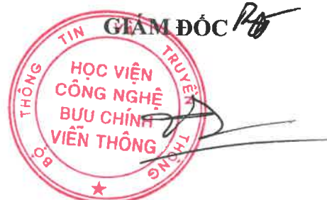
PGS.TS. Vũ Văn San

b) Áp dụng khoản 2 Điều 24, điểm b và điểm c khoản 1 Điều 32 của Quy định này đối với các khóa tuyển sinh từ sau ngày 18 tháng 05 năm 2017 đến trước ngày 15 tháng 08 năm 2021.